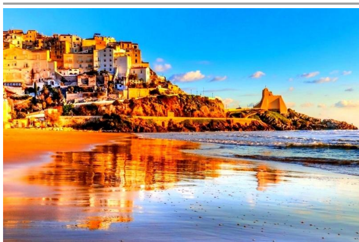
SPERLONGA: LA RIVIERA DI ULISSE - 15-20/6/2026

ISCRIVERSI PER PARTECIPARE. Pagare la quota in Sede o in banca (Iban: IT03Y 03069 09606 1000 00017244). Comunicare cognome e nome, data e luogo di nascita, indirizzo, Cap, telefoni, indirizzo di posta elettronica.